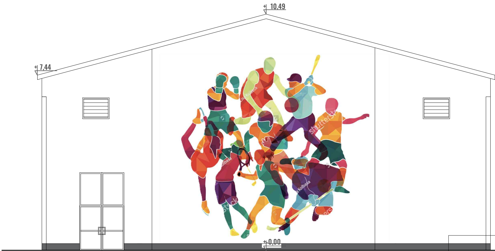
8- rozwinięcie elewacji południowej